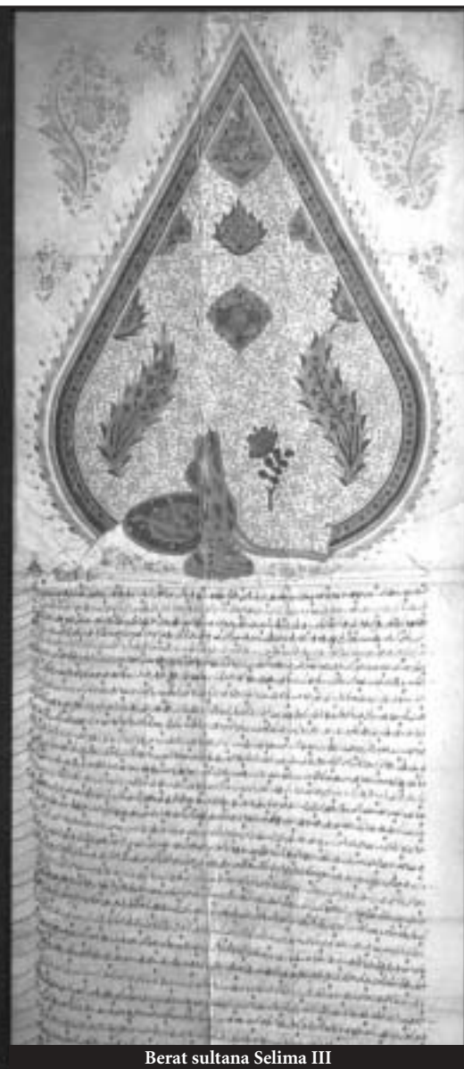
Berat sultana Selima III