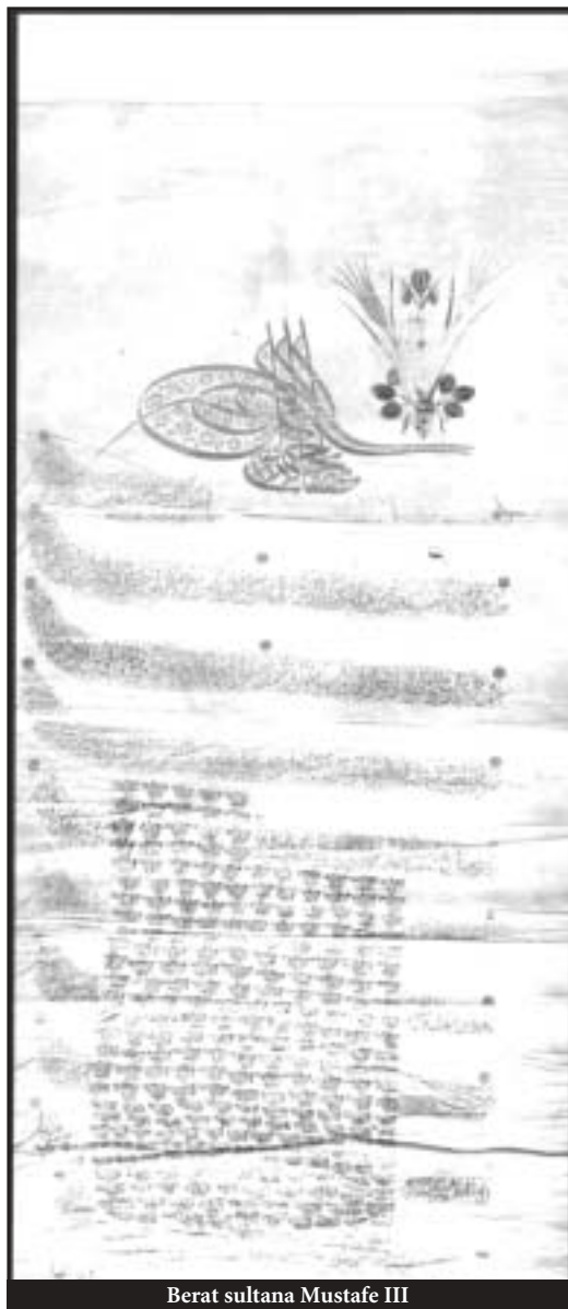
Berat sultana Mustafe III

Da se vratimo nadimcima koji su bili i poruka o čoveku i poruga, i koji su generacijama rado ostajali nepromenljivi, pa otuda i mogućnost njihovog kasnijeg pretvaranja u prezimena. Po svedočenju sarajevskog hroničara Mule Mustafe Bašeskije mnogi domaći muslimani u Sarajevu nosili su, uz lično ime, i slavenske nadimke, a često su bili u javnosti poznati, što