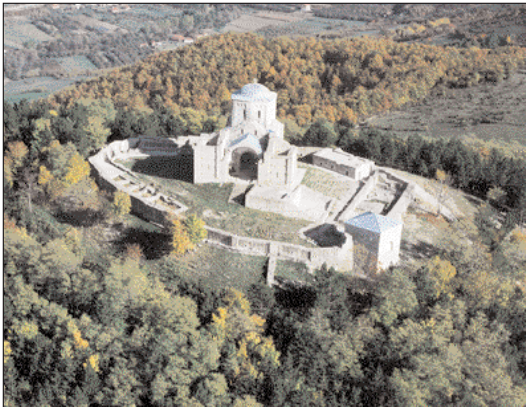
Manastir Đurđevi stupovi u okolini Novog Pazara, pogled iz vazduha

savešću koja ga osuđuje za njegovo pokoravanje slabostima. U skladu sa izopačenjem funkcije volje, razuma i savesti dolazi i do izopačenja funkcije religioznog iskustva.