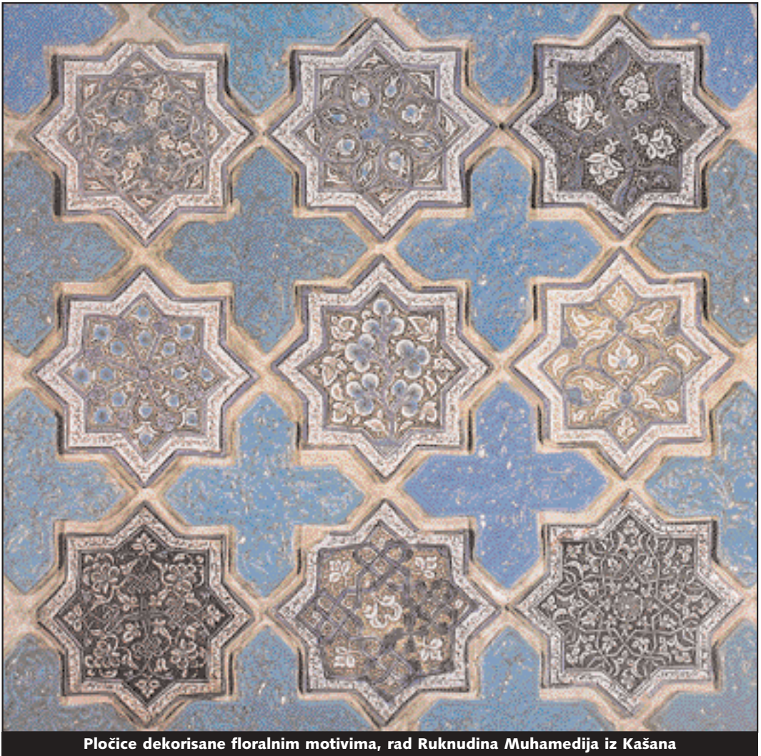
Pločice dekorisane floralnim motivima, rad Ruknudina Muhamedija iz Kašana

na Platonovu formulaciju prema kojoj je težnji za celinom i lovu na nju ime ljubav. „Njegov Gospod mu je“, kaže Ibn Arabi, „omilio žene da ih voli kao što Bog voli onoga koji jeste po njegovoj slici“. Muškarac treba da vidi Boga u ženi, i takvo viđenje Boga je potpunije nego ako Ga samo traži u sebi. U tom slučaju videće Ga samo u trpnom vidu. Naprotiv, ako Ga posmatra i u ženi, videće Ga i u radnom vidu, jer je žena postala prema njegovoj slici. Tako Ibn Arabi objašnjava hadis u kome Muhammed (s.a.v.s.) govori da su mu od zemaljskih stvari omiljene tri – žene, miris i molitva. Zato govori o polnom opštenju kao veličanstvenom. Ovde treba imati u vidu ono