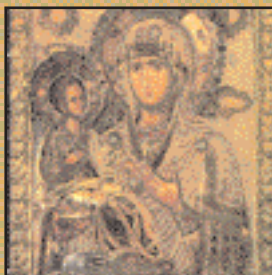
O VERI I LJUBAVI